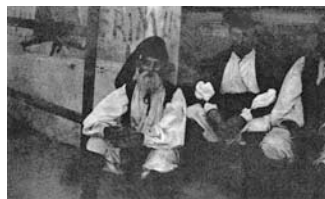
Nuoro, antico mercato in piazza Cavallotti (attuale piazza S. Giovanni)