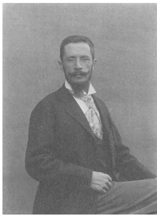
Ritratto di Antonio Ballero

Nuoro è il soggetto privilegiato della ricerca fotografica del pittore Antonio Ballero (Nuoro 1864-Sassari 1932), artista complesso, ai suoi esordi anche letterato, che attraverso il corpus delle circa 100 immagini proposte in mostra (selezionate tra le oltre 500 che costituiscono il suo archivio) restituisce pienamente al visitatore un momento di straordinaria vitalità intellettuale per la cittadina. Per dirla infatti con le parole di Marcello Fois, autore del saggio in catalogo, «quella a cavallo tra Ottocento e Novecento è una stagione che non risparmia la Belle Époque neanche alla sperduta piccola capitale della Barbagia». L'allestimento espositivo ricrea l'atmosfera del tempo, rievocando i salotti borghesi a cui erano destinate le pitture e i disegni di Ballero, proposti nella sezione introduttiva della mostra accanto ai materiali documentari che accompagnano quella biografica.