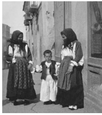
Nuoro, donne di Oliena con bambino