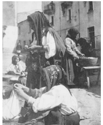
Nuoro, antico mercato in piazza Cavallotti (attuale piazza S. Giovanni)