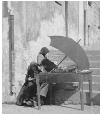
Nuoro, antico mercato in piazza Cavallotti (attuale piazza S. Giovanni)