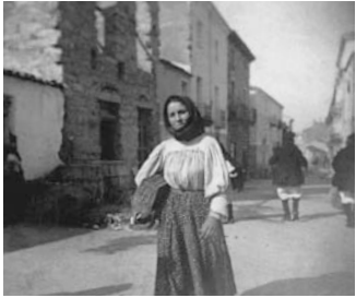
Nuoro, corso Garibaldi, ultimi anni dell'800