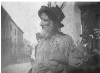
Nuoro, viandante, primi anni del '900