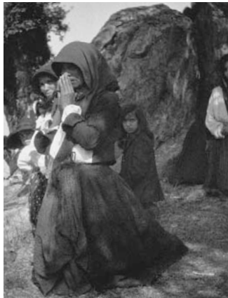
Nuoro, donne in preghiera sul Monte Ortobene