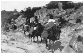
Il rientro dalla festa