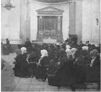
Nuoro, cattedrale di S. Maria della Neve, donne in preghiera, ante 1910