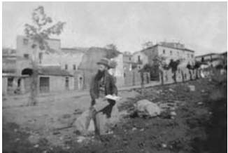
Nuoro, piazza d'Armi (attuale piazza Vittorio Emanuele), ultimi anni dell'800