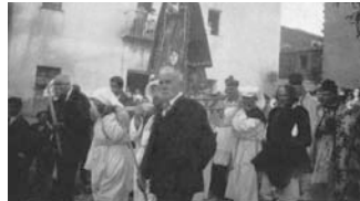
Nuoro, processione pasquale