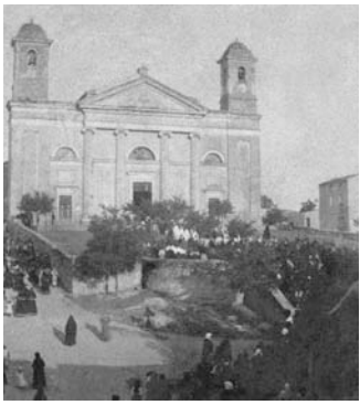
Nuoro, cattedrale di S. Maria della Neve, processione, primi anni del '900