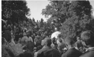
Nuoro, processione sul Monte Ortobene