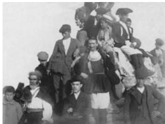
Nuoro, Monte Ortobene, ai piedi della statua del Redentore, post 1901