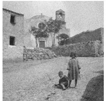
Nuoro, la vecchia chiesa di N.S. delle Grazie, post 1915