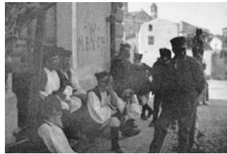
Nuoro, piazza Cavallotti (attuale piazza S. Giovanni)