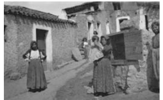
Nuoro, Sos sette fochiles